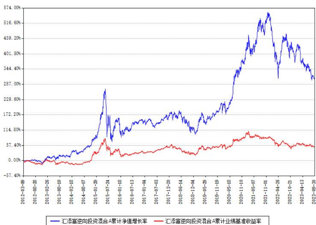
汇添富逆向投资混合A累计净值增长率与同期业绩比较基准收益率对比图