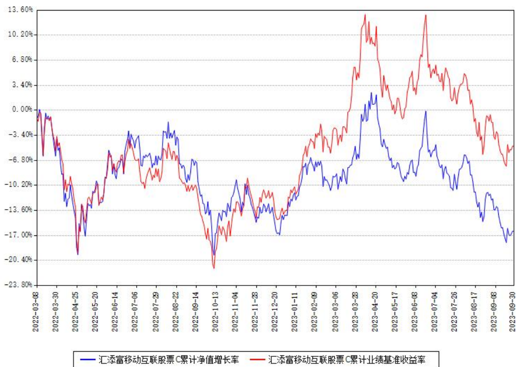
汇添富移动互联股票D累计净值增长率与同期业绩基准收益率对比图