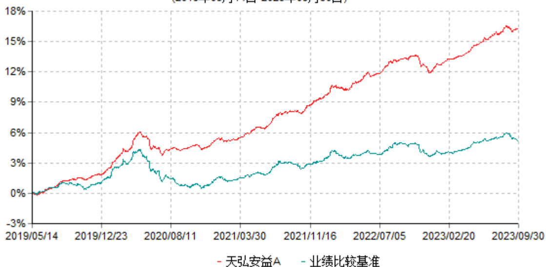
天弘安益A累计净值增长率与业绩比较基准收益率历史走势对比图 (2019年05月14日-2023年09月30日)