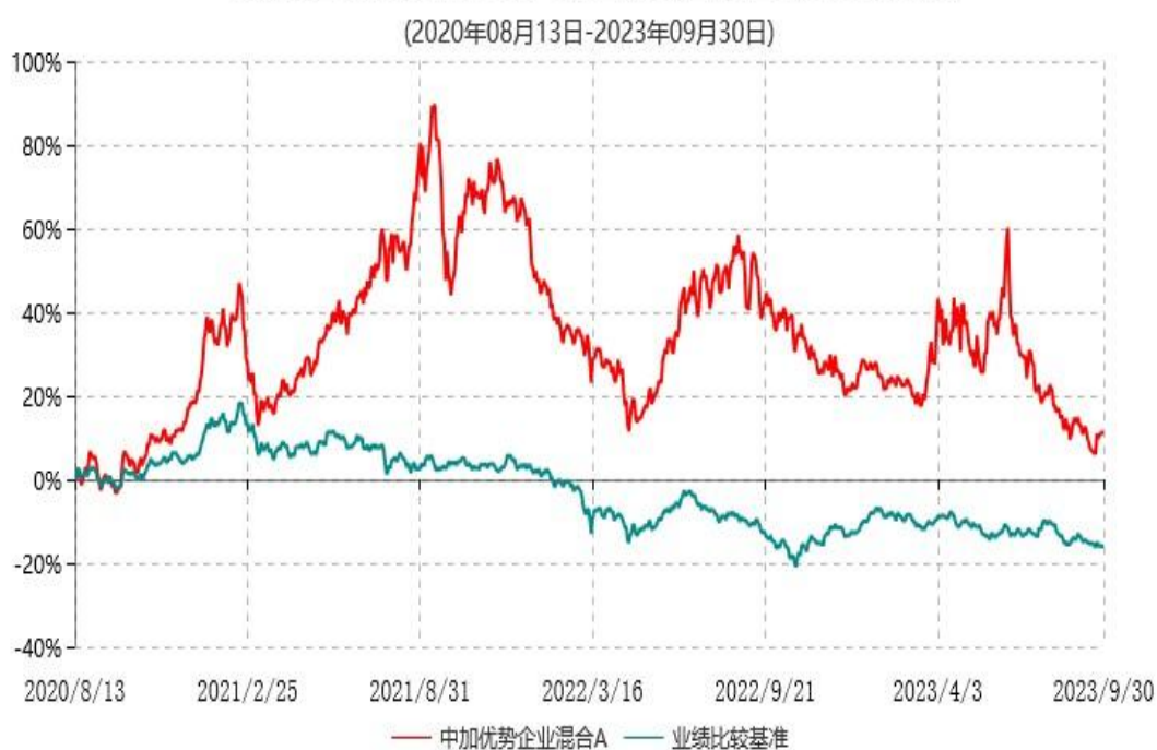
中加优势企业混合A累计净值增长率与业绩比较基准收益率历史走势对比图