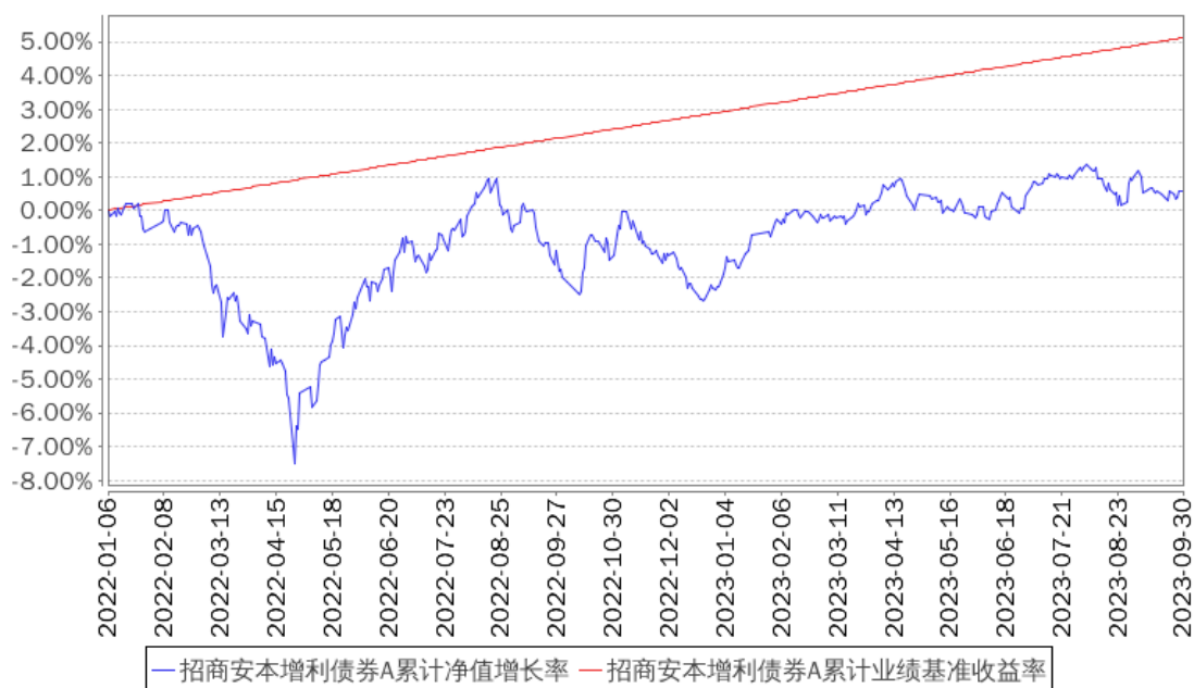
招商安本增利债券A累计净值增长率与同期业绩比较基准收益率的历史走势对比图