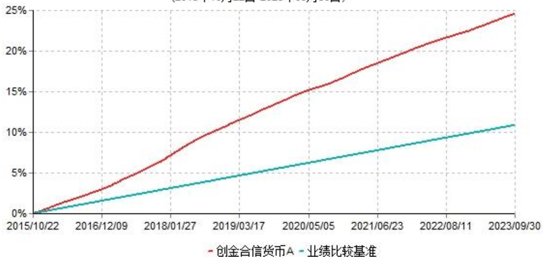
创金合货币 A 累计净值收益率与业绩比较基准收益率历史走势对比图 (2015年10月22日-2023年09月30日)