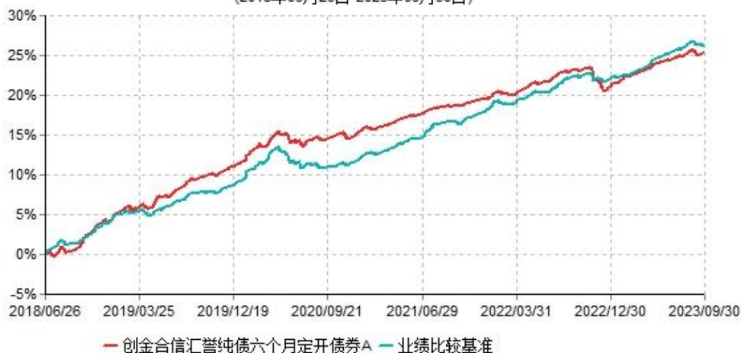
创金合信汇誉纯债六个月定期开债券A累计净值增长率与业绩比较基准收益率历史走势对比图 (2018年06月26日-2023年09月30日)