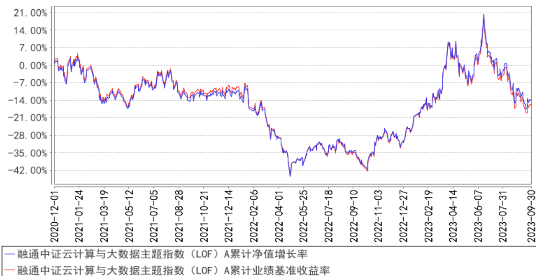
融通中证云计算与大数据主题指数（LOF）A 累计净值增长率与同期业绩比较基准收益率的历史走势对比图