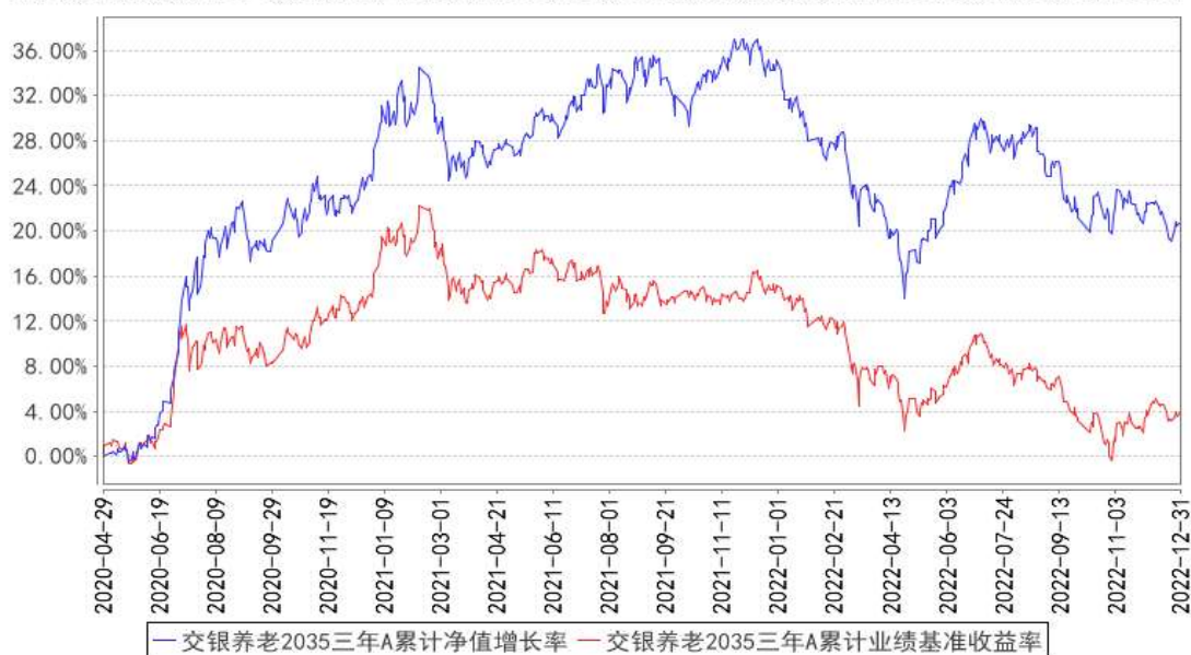
交银养老2035三年A累计净值增长率与同期业绩比较基准收益率的历史走势对比图