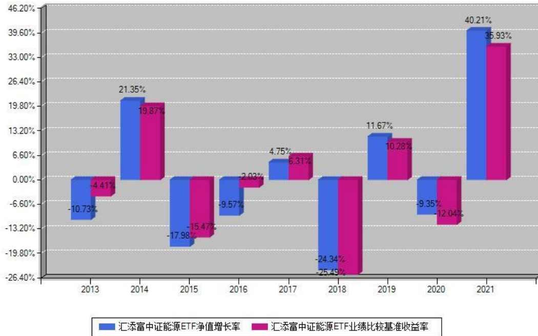
汇添富中证能源ETF每年净值增长率与同期业绩基准收益率对比图

注：基金的过往业绩不代表未来表现。本《基金合同》生效之日为2013年08月23日，合同生效当年按实际存续期计算，不按整个自然年度进行折算。