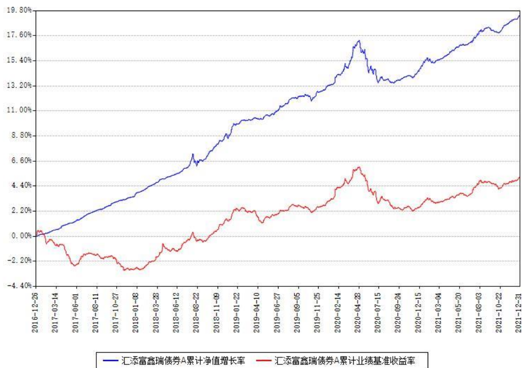
汇添富鑫瑞债券A累计净值增长率与同期业绩基准收益率对比图