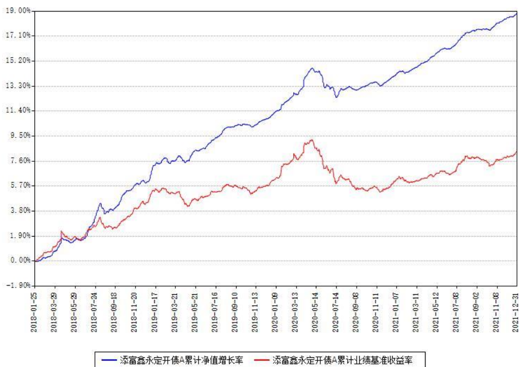
添富鑫永定开债A累计净值增长率与同期业绩基准收益率对比图