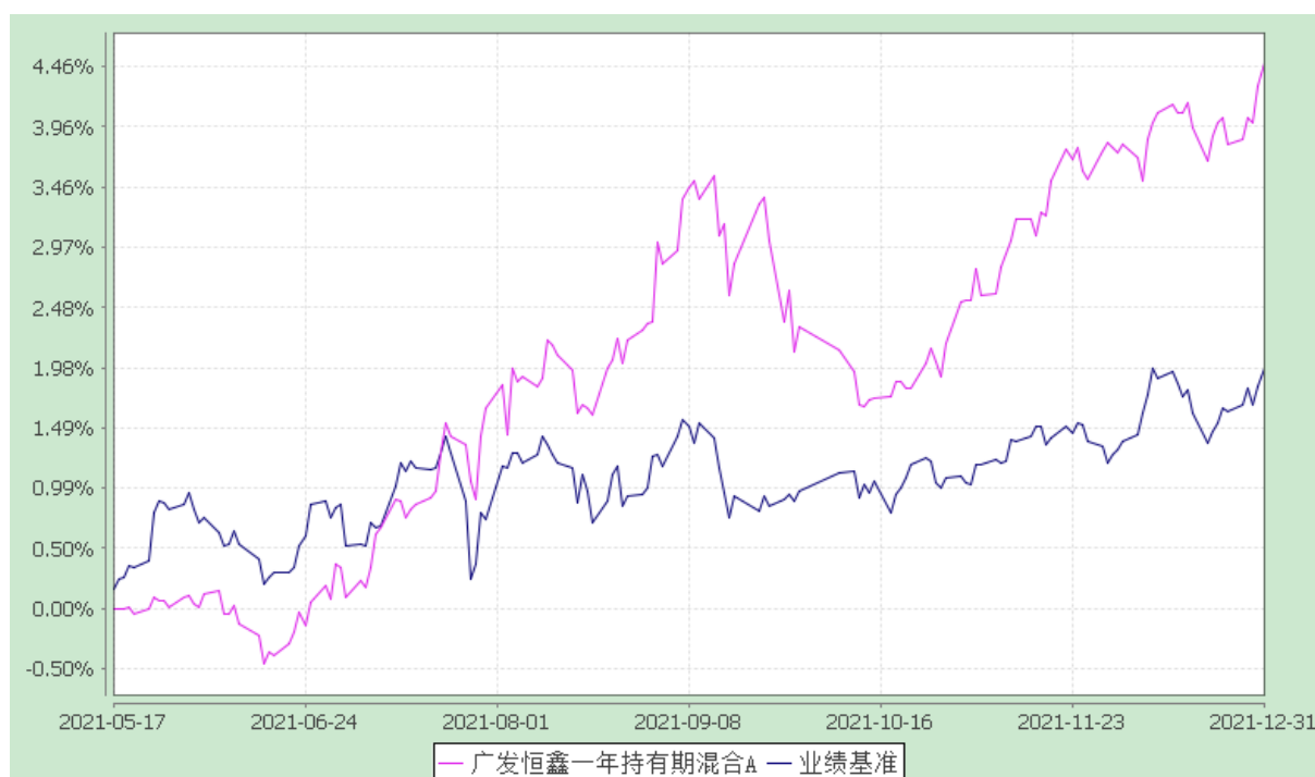
广发恒鑫一年持有期混合 C