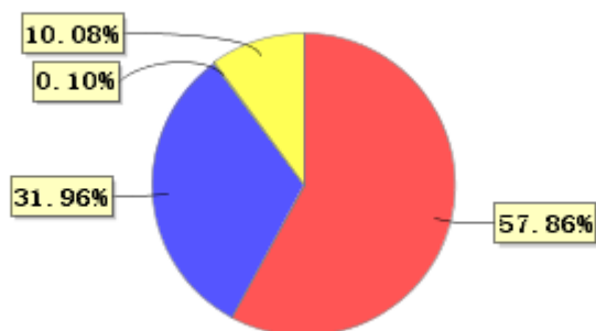
投资组合资产配置图表(2022年9月30日)

● 固定收益投资 ● 买入返售金融资产 ● 其他各项资产 ● 银行存款和结算备付金合计