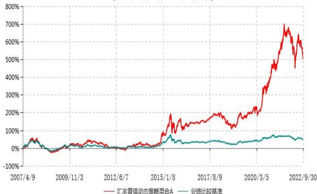
汇丰晋信动态策略混合A累计净值增长率与业绩比较基准收益率历史走势对比图 (2007年04月09日-2022年09月30日)

注：1. 按照基金合同的约定，本基金的投资组合比例为：股票占基金资产的 30%-95%；除股票以外的其他资产占基金资产的 5%-70%，其中现金（不包括结算备付金、存出保证金、应收申购款等）或到期日在一年期以内的政府债券的比例合计不低于基金资产净值的 5%。本基金自基金合同生效日起不超过六个月内完成建仓。截止 2007 年 10 月 9 日，本基金的各项投资比例已达到基金合同约定的比例。