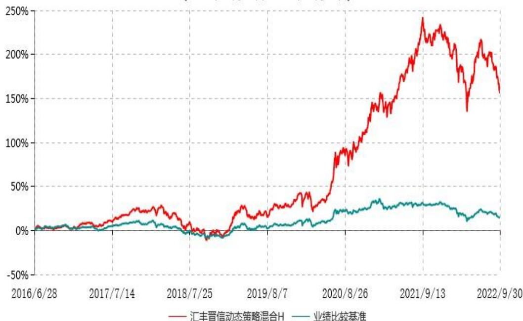
汇丰晋信动态策略混合H累计净值增长率与业绩比较基准收益率历史走势对比图 (2016年06月28日-2022年09月30日)

注：1. 按照基金合同的约定，本基金的投资组合比例为：股票占基金资产的 30%-95%；除股票以外的其他资产占基金资产的 5%-70%，其中现金（不包括结算备付金、存出保证金、应收申购款等）或到期日在一年期以内的政府债券的比例合计不低于基金资产净值的 5%。