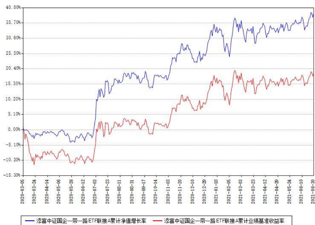
添富中证国企一带一路ETF联接A累计净值增长率与同期业绩基准收益率对比图