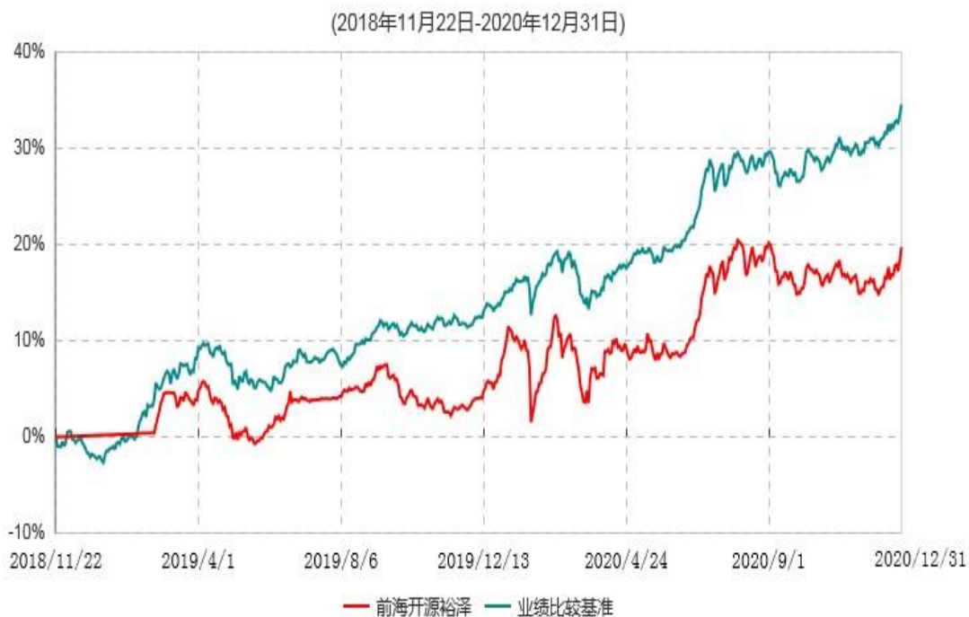
前海开源裕泽定期开放混合型基金中基金（FOF）累计净值增长率与业绩比较基准收益率历史走势对比图