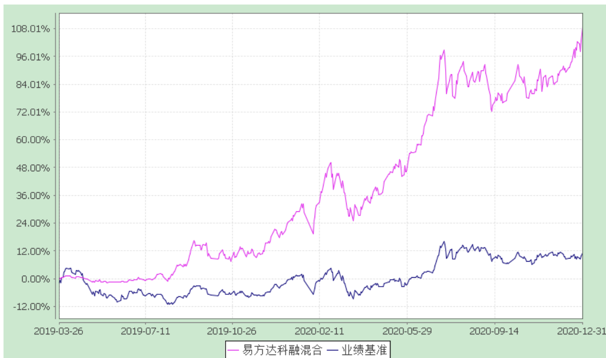
易方达科融混合型证券投资基金 份额累计净值增长率与业绩比较基准收益率历史走势对比图 (2019年3月26日至2020年12月31日)

注：自基金合同生效至报告期末，基金份额净值增长率为 108.82%，同期业绩比较基准收益率为 11.08%。