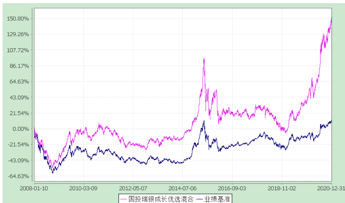
国投瑞银成长优选混合型证券投资基金 份额累计净值增长率与业绩比较基准收益率的历史走势对比图 (2008 年 1 月 10 日至 2020 年 12 月 31 日)

注：本基金建仓期为自基金合同生效日起的六个月。截至建仓期结束，本基金各项资产配置比例符合基金合同及招募说明书有关投资比例的约定。