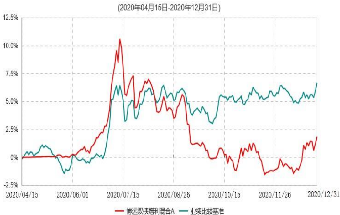
博远双债增利混合A累计净值增长率与业绩比较基准收益率历史走势对比图