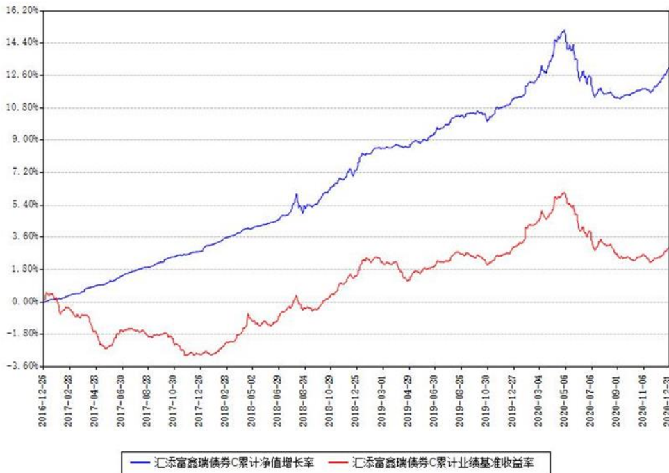
汇添富鑫瑞债券C累计净值增长率与同期业绩基准收益率对比图