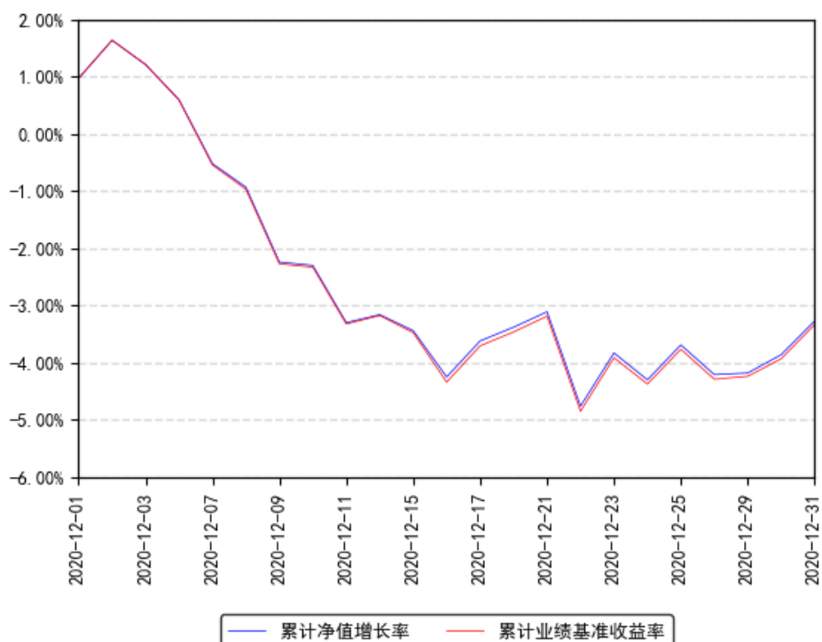
南方中证高铁产业指数累计净值增长率与同期业绩比较基准收益率的历史走势对比图

注：本基金转型日期为2020年12月1日，本基金合同于2020年12月1日生效，截至本报告期末基金成立未满一年；自基金成立日起6个月内为建仓期，截至报告期末基金尚未完成建仓。