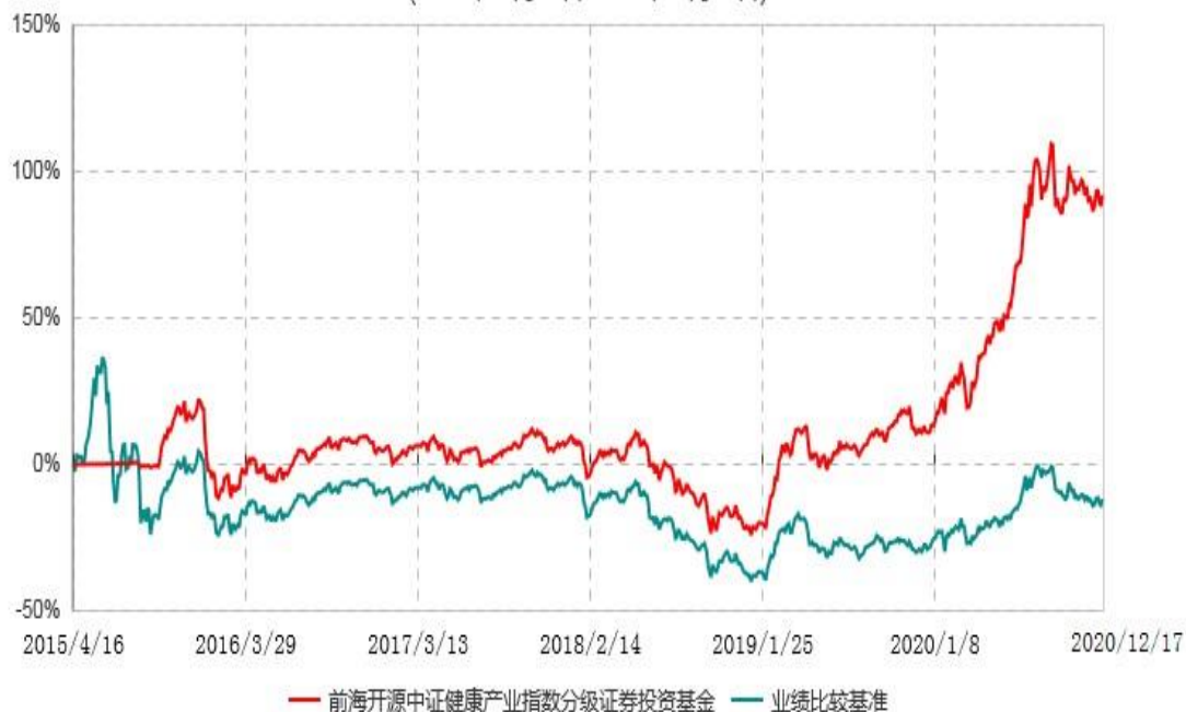
前海开源中证健康产业指数分级证券投资基金累计净值增长率与业绩比较基准收益率历史走势对比图 (2015年04月16日-2020年12月17日)