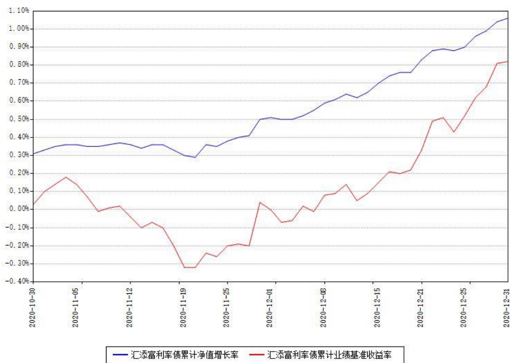
汇添富利率债累计净值增长率与同期业绩基准收益率对比图

注：1、本《基金合同》生效之日为 2020 年 10 月 30 日，截至本报告期末，基金成立未满一年。