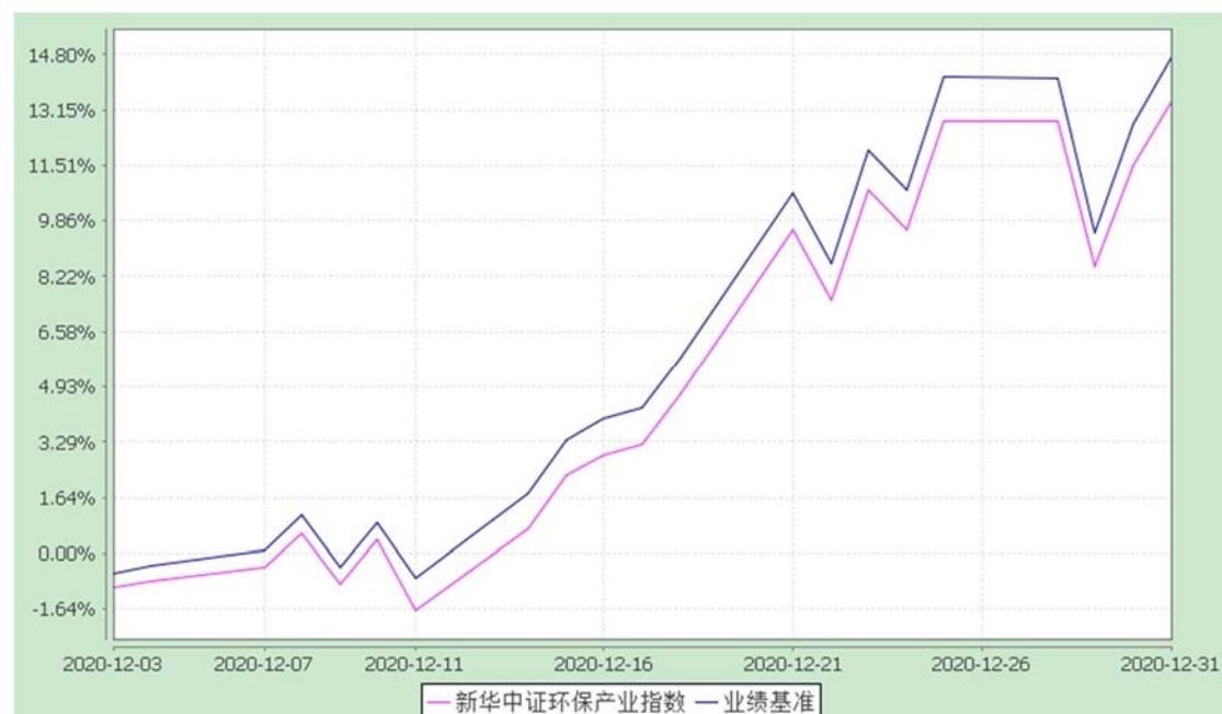
新华中证环保产业指数证券投资基金 份额累计净值增长率与业绩比较基准收益率历史走势对比图 (2020年12月3日-2020年12月31日)

注: 1、本基金转换基准日为2020年12月1日,在份额转换基准日日终,以份额转换后1.000元的基金份额净值为基准,根据新华环保A份额和新华环保B份额的转换比例对转换基准日登记在册的基金份额实施转换。自2020年12月3日起,本基金的基金名称变更为“新华