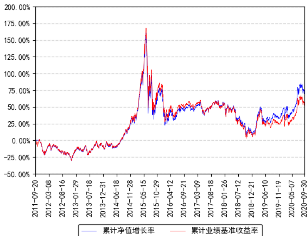
南方上证380ETF联接A累计净值增长率与同期业绩比较基准收益率的历史走势对比图