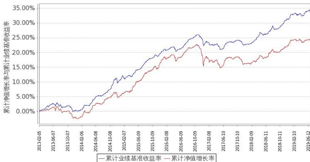
图 2: 嘉实中证中期企业债指数 (LOF) C 基金份额累计净值增长率与同期业绩比较基准收益率的历史走势对比图