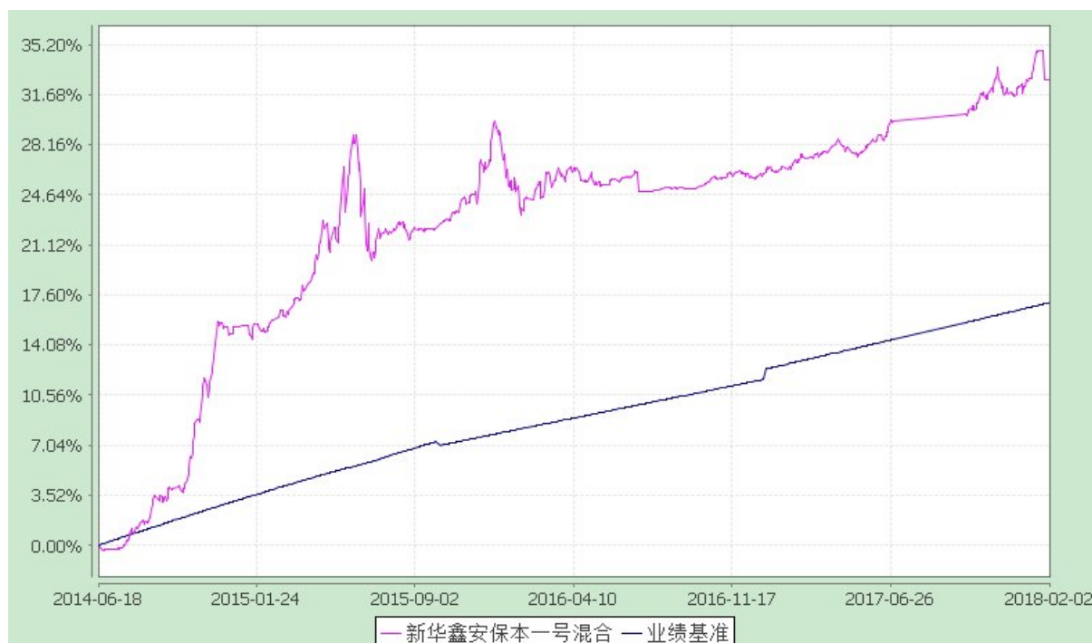
新华鑫安保本一号混合型证券投资基金 份额累计净值增长率与业绩比较基准收益率的历史走势对比图 (2014 年 6 月 18 日至 2018 年 2 月 2 日)