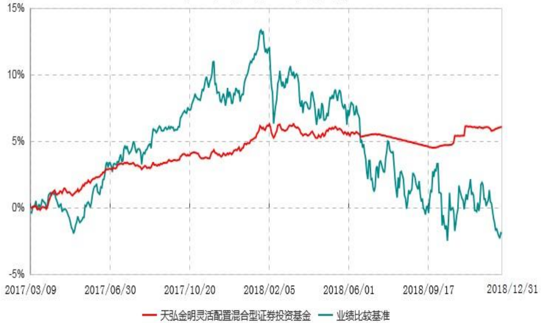
天弘金明灵活配置混合型证券投资基金累计净值增长率与业绩比较基准收益率历史走势对比图 (2017年03月09日-2018年12月31日)