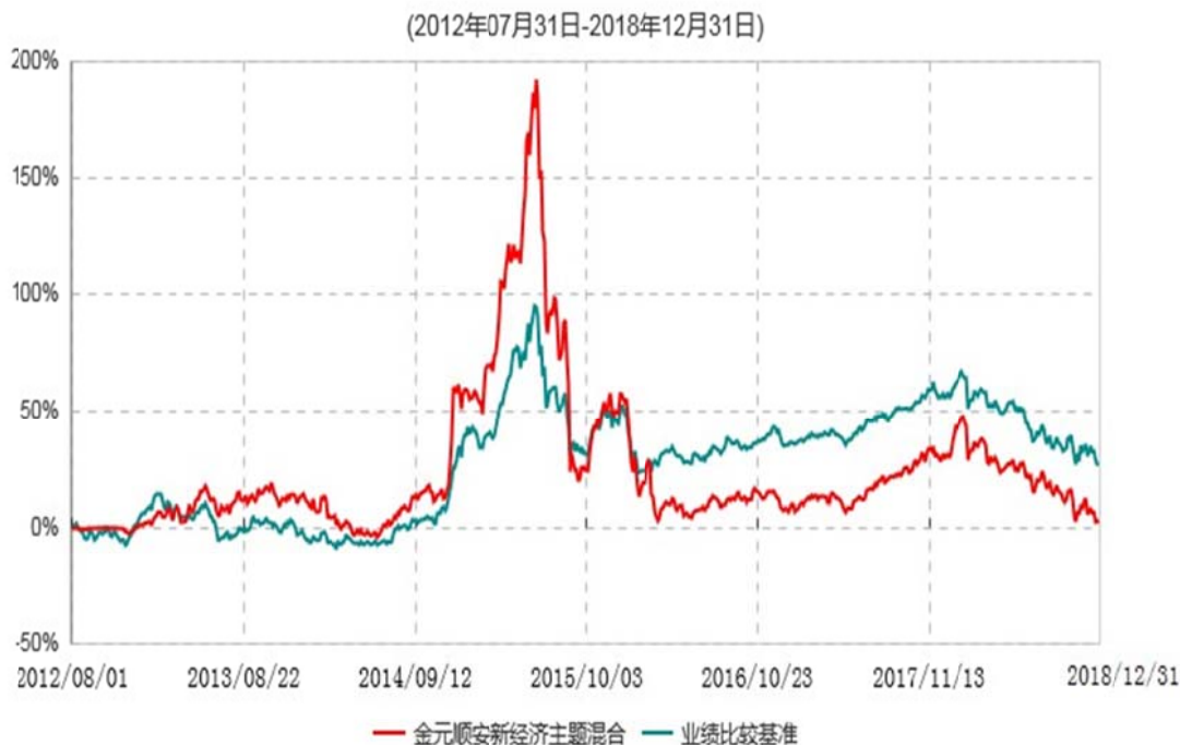
金元顺安新经济主题混合型证券投资基金累计净值增长率与业绩比较基准收益率历史走势对比图