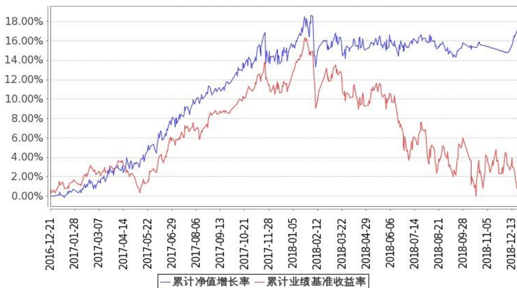
图：嘉实新添瑞混合基金份额累计净值增长率与同期业绩比较基准收益率的历史走势对比图