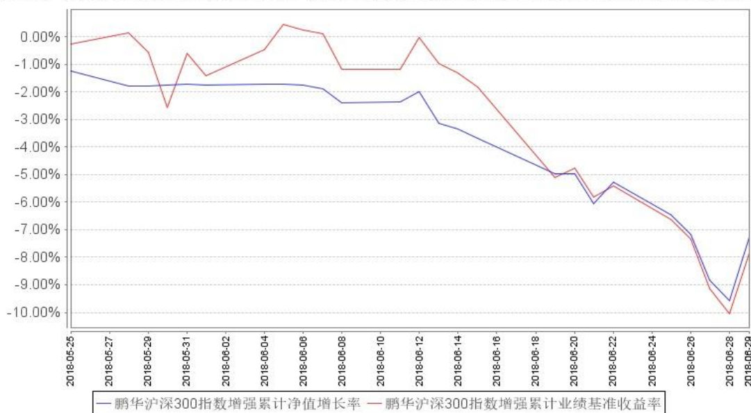
鹏华沪深300指数增强累计净值增长率与同期业绩比较基准收益率的历史走势对比图

注：1、本基金基金合同于 2015 年 8 月 13 日生效。2、截至建仓期结束，本基金的各项投资比例已达到基金合同中规定的各项比例。