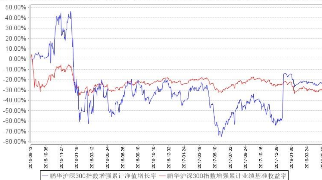
鹏华沪深300指数增强累计净值增长率与同期业绩比较基准收益率的历史走势对比图

注：1、本基金基金合同于 2015 年 8 月 13 日生效。2、截至建仓期结束，本基金的各项投资比例已达到基金合同中规定的各项比例。