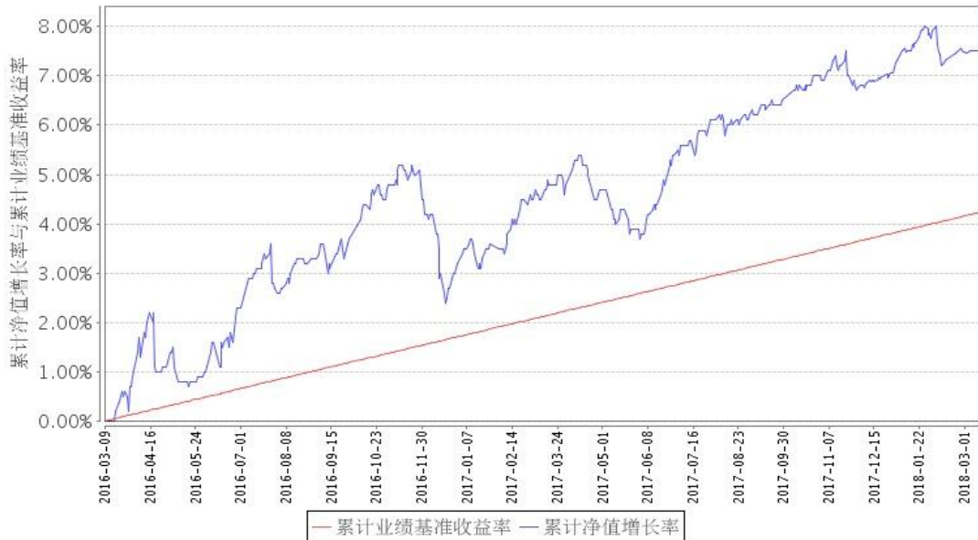
安信安盈保本A累计净值增长率与同期业绩比较基准收益率的历史走势对比图