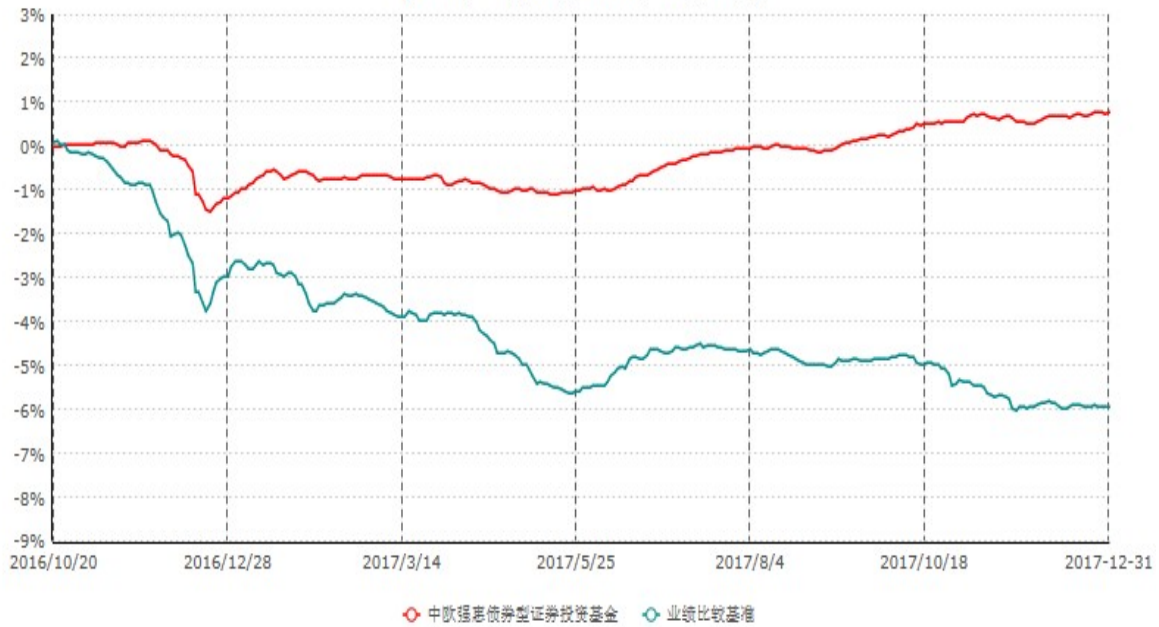
中欧强惠债券型证券投资基金累计净值增长率与业绩比较基准收益率历史走势对比图 (2016年10月20日-2017年12月31日)

注：本基金基金合同生效日期为2016年10月20日，按基金合同的规定，本基金自基金合同生效起六个月为建仓期，建仓期结束时本基金的各项资产配置比例已达到基金合同的规定