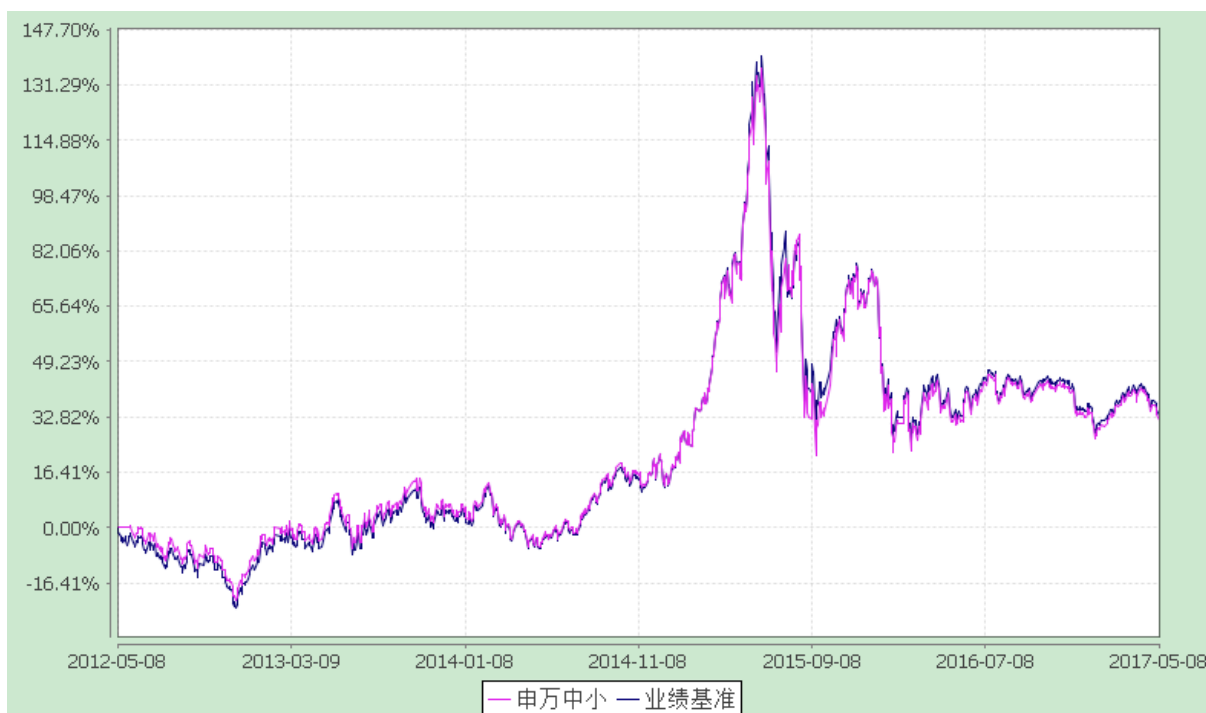
申万菱信中小板指数分级证券投资基金 份额累计净值增长率与业绩比较基准收益率历史走势对比图 (2017年1月1日至2017年5月8日)

注：1.根据《基金合同》的相关规定，原申万菱信中小板指数分级证券投资基金分级运作期共包含五个运作周年。分级运作期结束，无需召开基金份额持有人大会，自动转换为上市开放式基金（LOF）。2017年5月8日，申万菱信中小板指数分级证券投资基金分级运作期结束，申万菱信中小板指数分级证券投资基金之稳健收益类份额、申万菱信中小板指数分级证券投资基金之积极进取类份额按照《基金合同》约定折算成场内申万菱信中小板指数分级证券投资基金之申万中小板份额，基金名称变更为“申万菱信中小板指数证券投资基金（LOF）”；