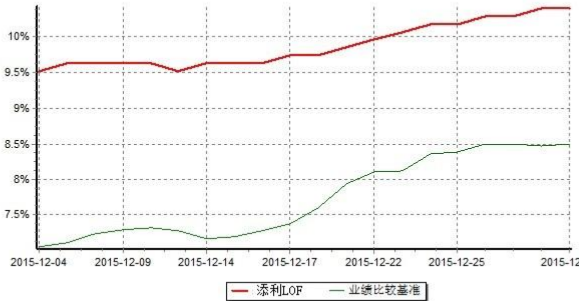
天弘添利债券型证券投资基金（LOF） 份额累计净值增长率与业绩比较基准收益率历史走势对比图 (2015年12月04日-2015年12月31日)