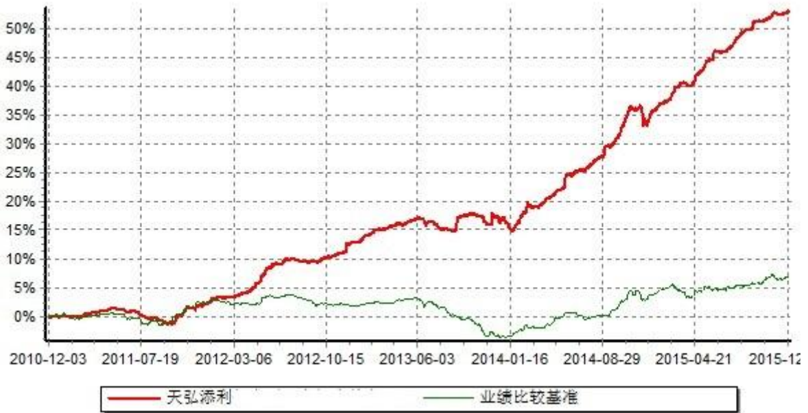
天弘添利分级债券型证券投资基金 份额累计净值增长率与业绩比较基准收益率历史走势对比图 (2010年12月03日-2015年12月03日)