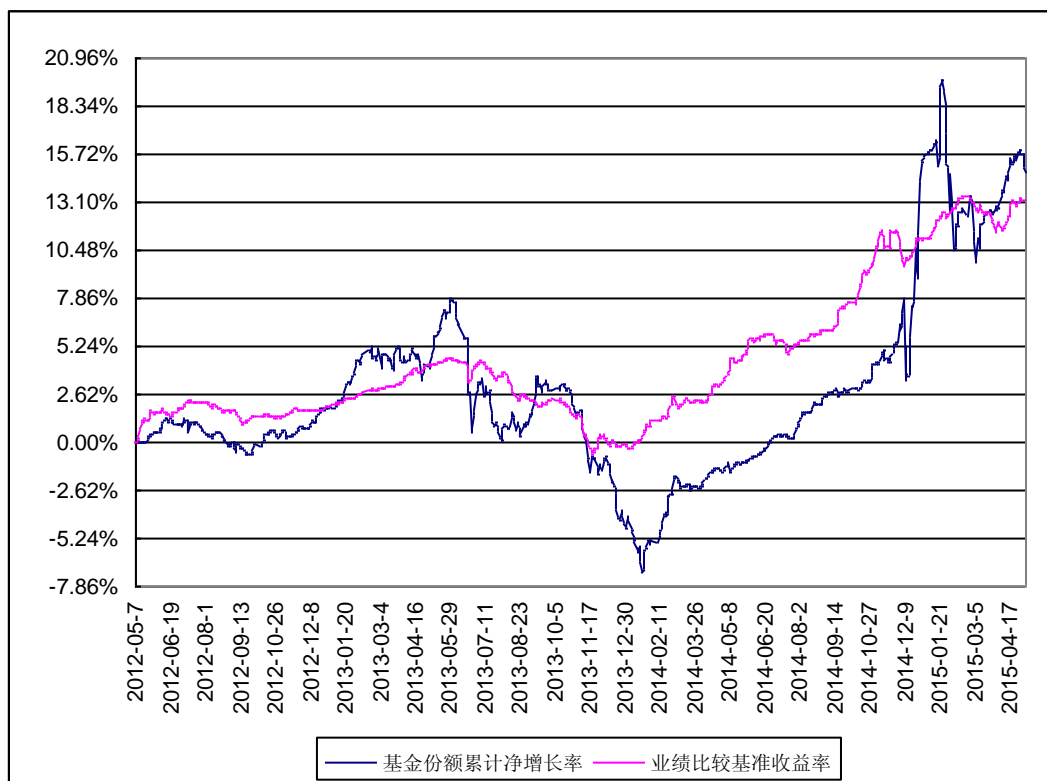
信达澳银稳定增利分级债券型证券投资基金 转型前份额累计净值增长率与同期业绩比较基准收益率历史走势对比图 (2012 年 5 月 7 日至 2015 年 5 月 6 日)