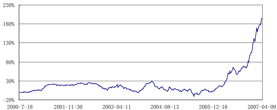
基金安瑞份额累计净值增长率历史走势图 2000/7/18--2007/4/9