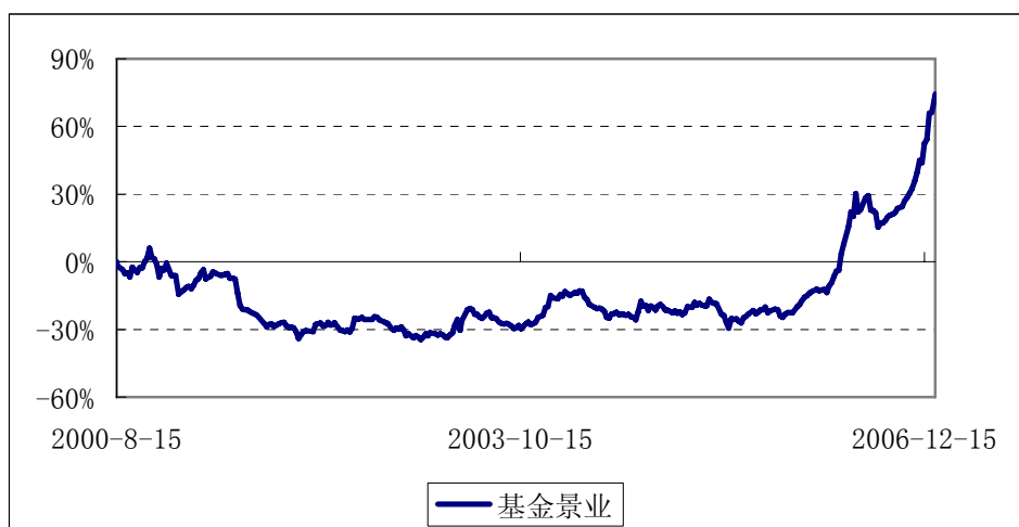
基金景业累计份额净值增长率历史走势图 (2000年8月15日至2007年1月15日)

注：1、按基金合同规定，本基金自基金上市之日起6个月内为建仓期，截至报告日本基金的各项投资比例已达到基金合同第七条之（五）投资组合中规定的各项比例：本基金投资于股票、债券的比例，不得低于基金资产总值的80%；投资于国家债券的比例，不得低于基金资产净值的20%；持有一家上市公司的股票，不超过基金资产净值的10%。